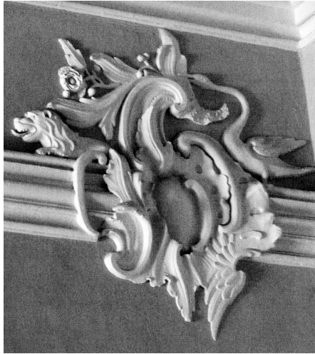
Rokoko Rocaille – et afrokokoens (slut 1700) symbolelementer. Forandringen fra barokkens strenge symmetri til rokokoens mere lette svungne mønstre. Rocailen kunne være del af stukudsmykningen på slotte og herregårde.

Ved hoffet var teater, baller, tafler og anden selskabelighed en del af dagligdagen. Hos adelen uden for København og specielt i Jylland, var der ikke disse muligheder. Ofte var der end ikke adelige nok i nærheden til, at der kunne holdes et bal med adelige alene. Det fik stor betydning for udviklingen, at adelen var nødt til at blande sig med borgerskabet for at have mulighed for at have et selskabsliv. De sociale relationer, der skabtes, når adel og borgerskab var sammen, kunne re-