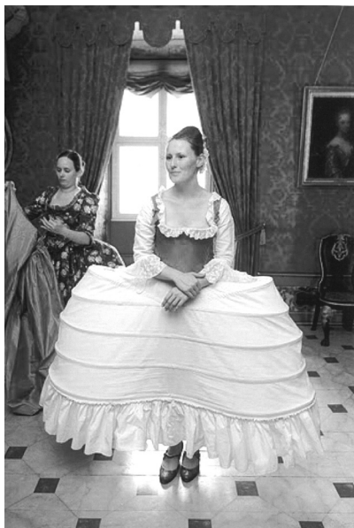
Brede skorter krævede et stativ for at holdes på plads. Her ses panieret til en Robe de Cour – en hofkjole. Der er syet stivere i panieret i lodrette baner. Dette sikrer, at formen holdes.

For enden af den smalle grusvej ligger et stort hus. Huset er flankeret af lange ladebygninger. Foran huset springer vandet i et kunstigt bassin. Huset står i røde mursten og er prydet af tegltag. Bygningerne er placeret og opbygget efter barokkens strenge krav til symmetri. Hovedhusets fordør findes midt på bygningen, og på hver side af denne er præcis lige mange vinduer. Huset er i to etager. Der er utallige gemakker, sale og værelser, alle prydet med smukke tapeter, malede plankegulve og møbler, der er importeret fra Frankrig. Herskabet tilhører den adel, der før 1660 havde en væsentlig rolle i den danske magtstruktur. Kontakten til hoffet havde allerede dengang været noget perifer. Fra Christian IV og op gennem Enevælden har man beklaget, at magten er blevet centraliseret i København. Efter at Frederik III i 1660 indførte enevælde, er det kun blevet værre. Den mere eller mindre konstante uddeling af privilegier og adling af personer nær kongen, bevirker, at medlemmer af adelen, der ikke bor eller opholder sig i København, meget let kommer ud på et sidespor. Selv familier, der tidligere har haft enorm magt, og som stadig besidder store rigdomme, har ikke længere fordums position og indflydelse.